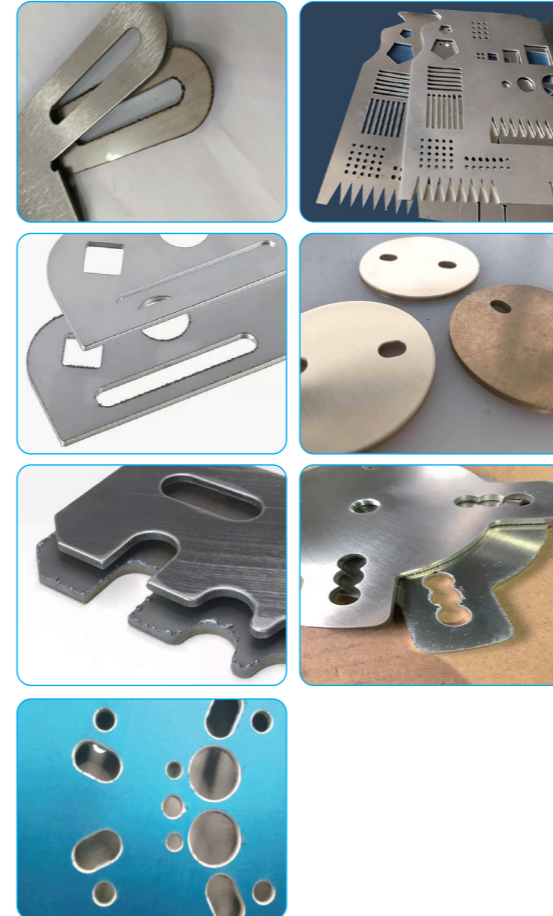
<보호필름 있는 상태에서 가공>